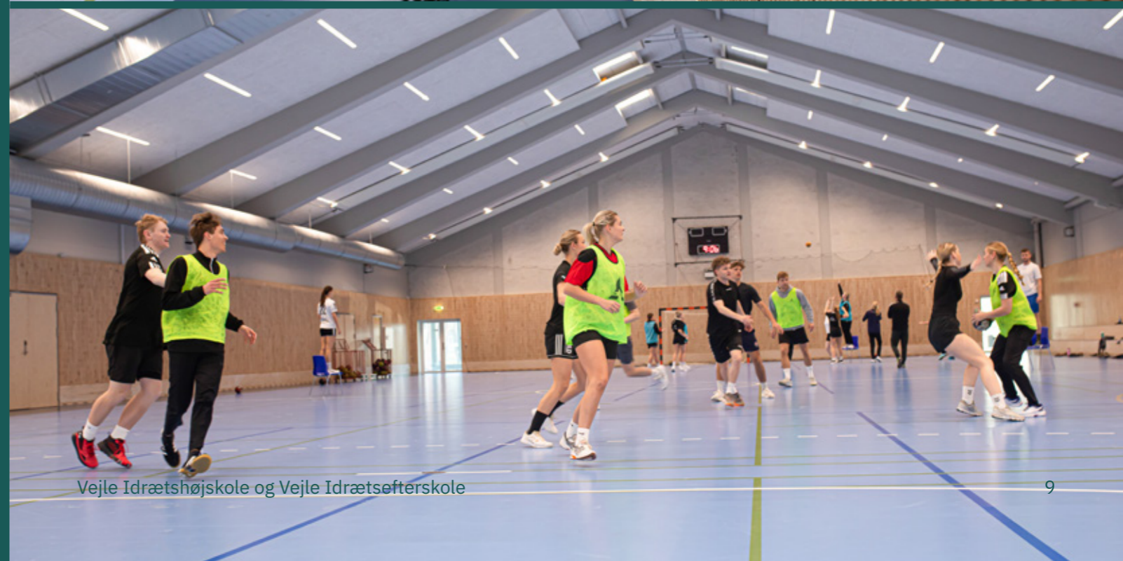
Vejle Idrætshøjskole og Vejle Idrætsefterskole